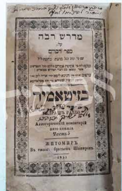
מדרש רבה זיטומר תר"א, מעובדו ר' יצחק בן מוהרנ"ת, שנתרם לביהמ"ס האר"י (הכתוב ע"י ר' איזיק מבוקרשט)

יצחק קיבל זאת באהבה וכתב: "והגם שנזרק עלינו קצת אבנים טובים, רק היה בחסד. וביום ראש חודש הלכנו על כל המקומות הקדושים, עד אשר באנו באחרונה אל מערת ישי אבי דוד והצדקת רות. בְּשֵׁם נפתח לבי עד למאוד, כי נזכר בלבי גודל עוצם קדושת ההתגלות של כבוד אדמו"ר הנחל נובע מקור חכמה זצוק"ל על הפסוק 'ויאמר בועז אל רות'". 23