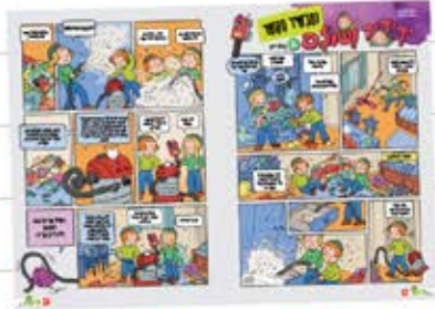
זעקה גדולה ומרה!

היום "כל הפושט יד נותנים לו" כשאתם יוצאים לשדה אל תשכחו את מאות ואלפי הבחורים שכל חשקם ורצונם הוא להמשיך ולשמור על יהדותם - הנמצאים במצב שאינו פשוט כלל. תקדישו כמה דקות מהזמן היקר הזה של חצות הלילה בפורים לבקש ולהתחנן להעביר רעת המן האגני ואת מחשבתו אשר חשב על היהודים.