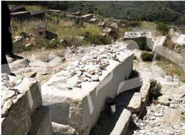
תמונה נדירה של ציון מרן ה'בית יוסף', סמוך לו קבר רבי יצחק בן מוהרנ"ת שכוסה באדמת סחף, צולם בשנת תשכ"ב