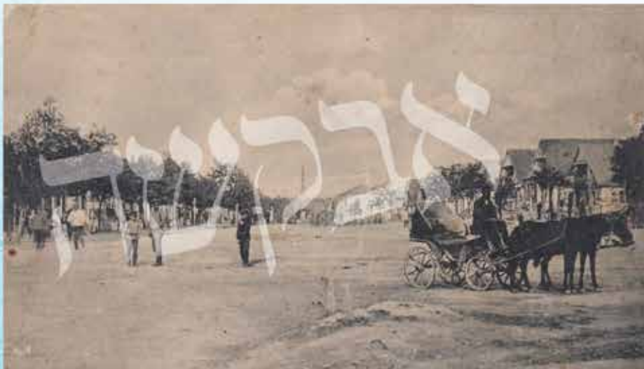
בלכתך לעבודה דבק מחשבתך בהשם. טולטשין בימים עברו

לא ארכו הימים והאהבה חזרה לשכון בינו ובין ידיד נעוריו כבימים ימימה. אז אמר רבי יצחק: "לעולם לא היתה מופרת הידידות העצומה בינינו, אלא שמשמים אינו זאת לידי, כדי שאיווכח בעצמי כמה צדק אבא בדבריו, כי אכן אין דבר בעולם - גם מצווה ומנהג טוב