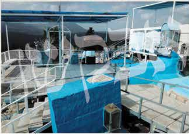
ציון רבי יצחק בן מוהרנ"ת - המצבה שהוגבהה לאחר בניית גשר ההליכה