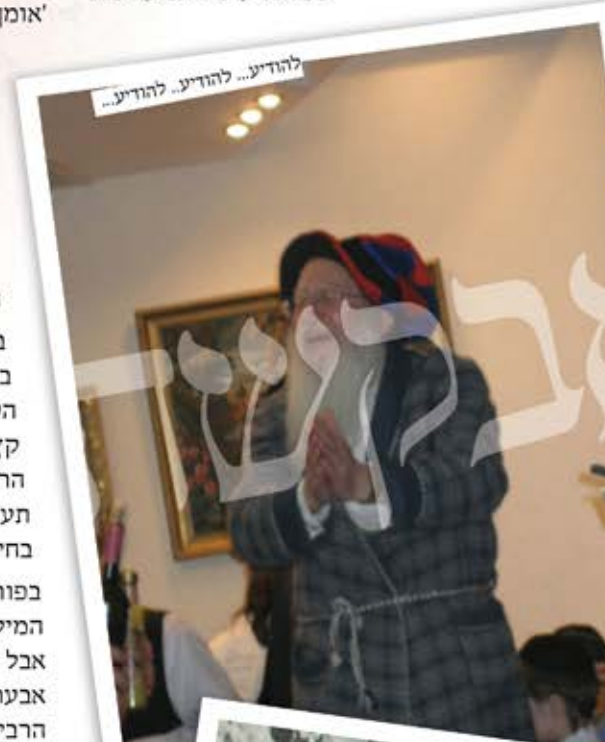
להודיע... להודיע... להודיע...