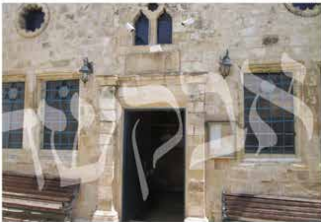
בית הכנסת האר"י האשכנזי, שבו התפלל ר' יצחק בן מוהרנ"ת

טוב כל תמנע, והעיקר רצונות טובים, ובפרט בעת הילוך על הפאסט (הדואר) תישא עיניך למרום וכל רצונך ומגמתך יהיה להטוב האמיתי. 13