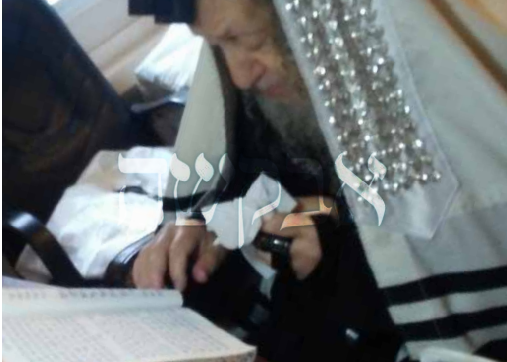
בנבוכת התפילה