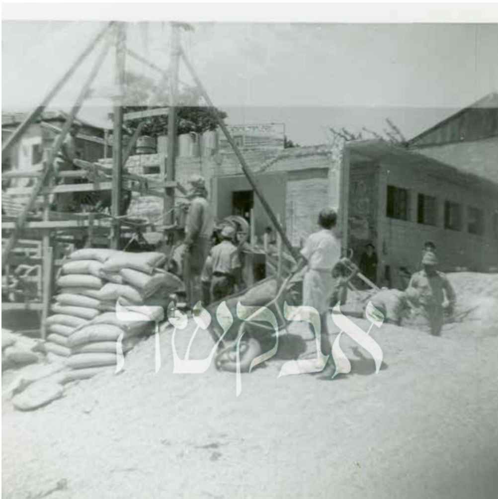
השול במאה שערים בתחילת בניית הקומה השנייה