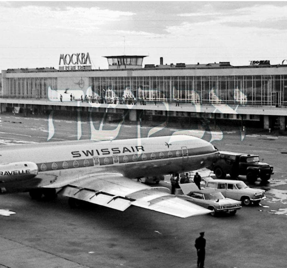
אימה וחרדה. נמל התעופה שרמטייבו במוסקבה