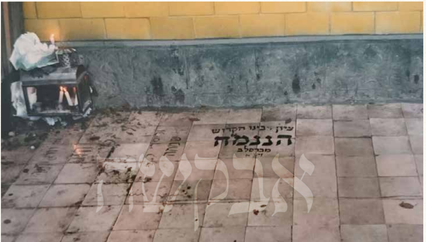
דעם רבי'נס ציון אין יענע יארן

זיינע קינדער טראָן דאָס איז אים גאר שווער אנגעקומען?! ווער איז געווען מסוגל זיך פארצושטעלן מיט זיינע אויגן ווי ר' שמואל דרייט זיך ארום - קלעטערנדיג מיט פארמאכטע אויגן אין די לופט פעלדער וואס רוישן שטענדיג מיט אלע שמוציגע תועבות פון עולם הזה!!?