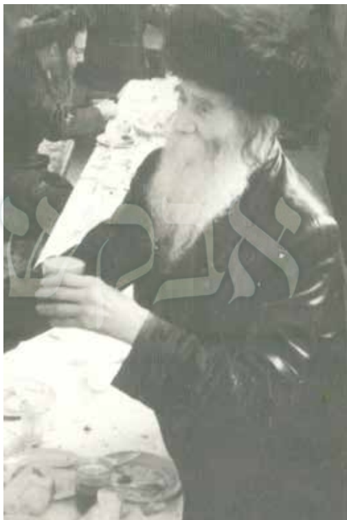
ר' אלחנן ספקטור