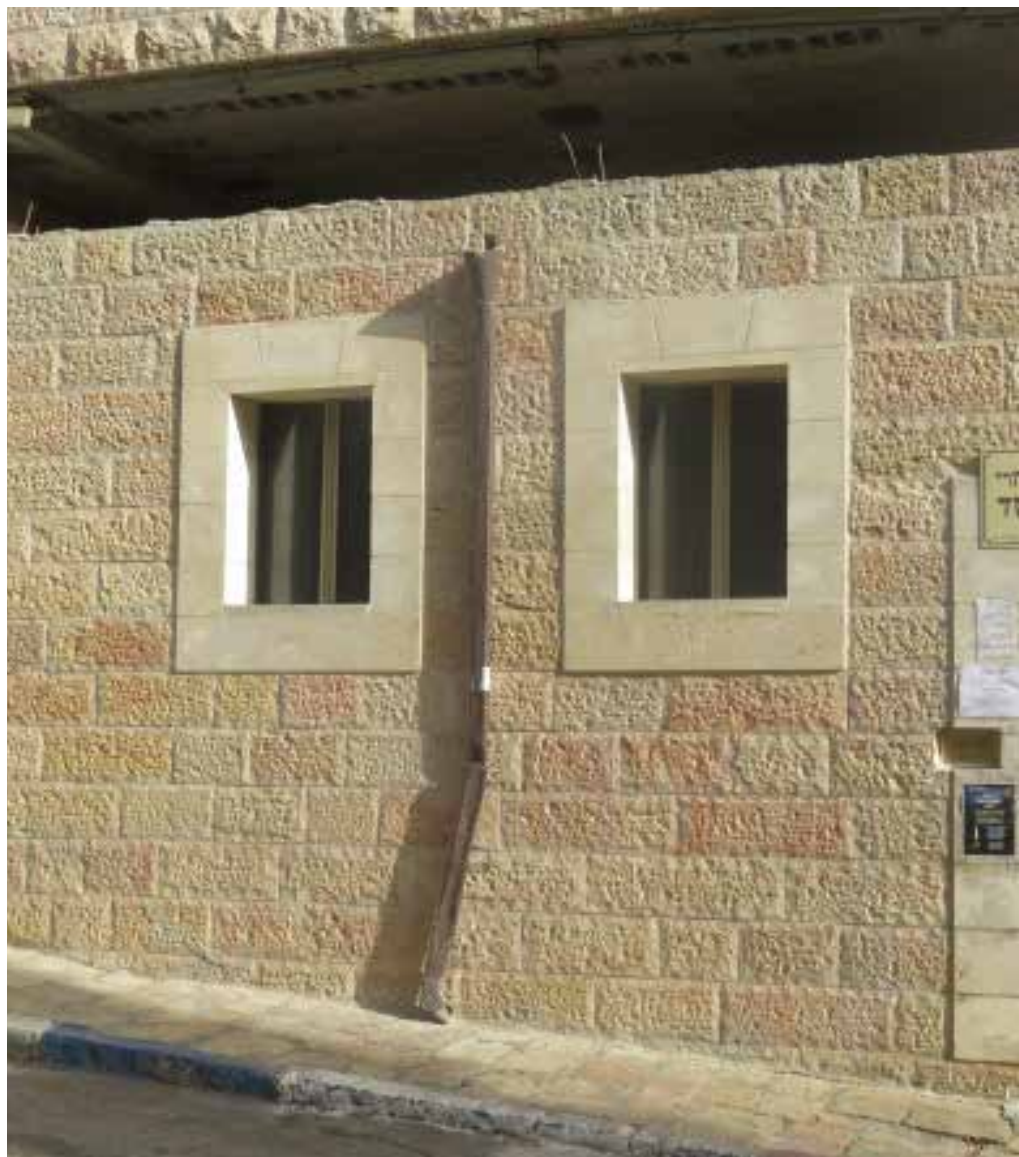
נבנה במסירות נפש. ביהכ"ס ברסלב בשערי חסד