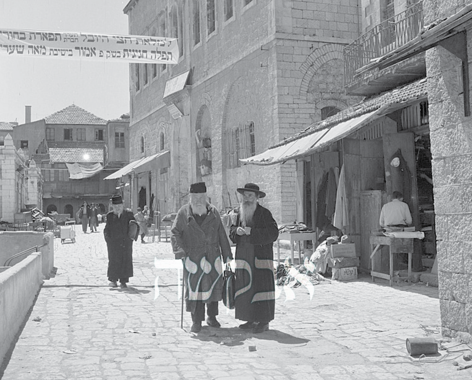
מאה שערים בימים ההם

ובתחנונים שנשלם לו עוד כסף, בכדי שיהיה לו כיצד לפרנס את משפחתו.