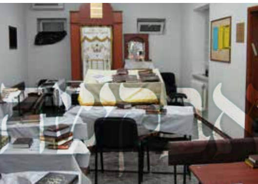
פנים בית המדרש במנורו

הירדן הזה' אותיות במקל"י ר"ת ליקוטי מוהר"ן. הוא היה אומר: כל אחד ואחד בכל מצב יכול לראות את פני הצדיק בספרו, גם הפחות שבפחותים, אין מי שיכול לפטור עצמו בתואנות שונות; אם יש לך הבנה בדף גמ' - תוכל להבין גם זאת... ואם לאו - קח חברותא, למד פעם אחר פעם, התפלל להקב"ה, שאל ממנו שיפתח לך ותזכה להבין דבריו הקדושים.