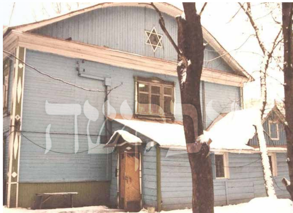
בית הכנסת מרינא רושצ'א כפי שהיה נראה באותם ימים

'התחלתי לבכות להם בדמעות ממש, התחננתי לפניהם שזו האמת היחידה ואין לי שום כוונה אחרת, ולמרבה הנס והתדהמה הם הסכימו לוותר ולא לעצור אף אחד, אבל דורשים בתוקף שכל הקבוצה תסתלק מיד מרוסיה'