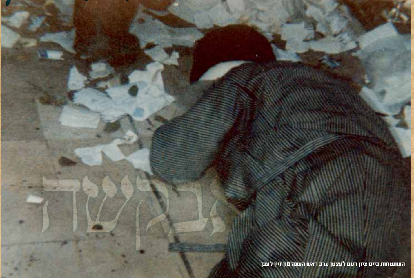
השתחוח ביים ציון דעם לעצטן ערב ראש השנה פון זיין לעבן