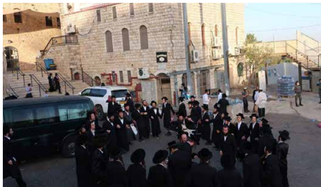
ריקודים ליד הציון לאחר הנס המופלא

לאחר התפילה החליטו אנ"ש נוסעי הטנדר לנסות לחדור דרך איזור בית ג'אן לעבר 'כסא של אליהו', היה זה עבורינו תקווה מחודשת להגיע אל המקום הנחשק. יצאנו עם הטנדר אל בין ההרים על שבילי העפר המובילים אל ה'כסא', אולם באמצע הדרך ציפתה לנו אכזבה קשה, ניידת משטרה שחסמה את השביל הכריחה אותנו לשוב על עקבותינו. שוב הננו מגורשים ומתרחקים מהאור הנערב, אך למרות הכל לא מרפים לרגע את הרצון. הנהג היקר חיפש מקום לנוח מעט מעמל הדרך והטלטולים הקשים, הצענו לו שיבוא לבית ההארה הדרוזי שבבית ג'אן, וכך בדרך מופלאה ביותר שבנו לאכסנייתנו.