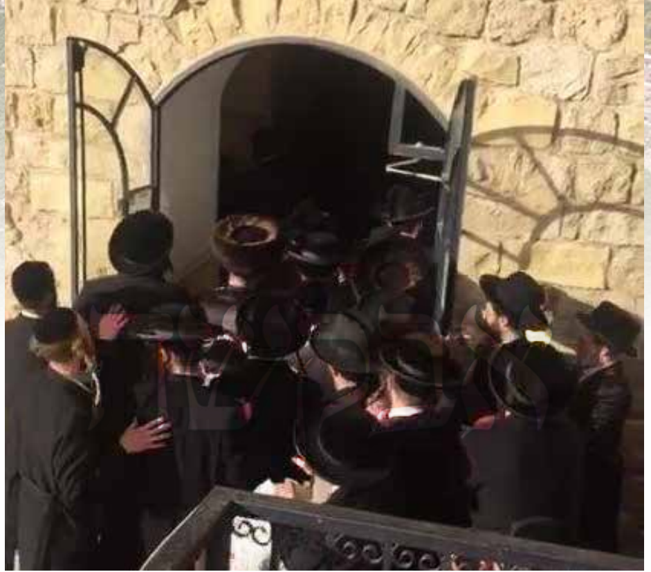
המוני היהודים נדחקים לתוך המערה לאחר הסרת המחסומים

על סלע גבוה, כדי שתהיה קליטה לפלאפון. בידו האחת שוחח במכשיר אחד עם אנשי החילוץ, ובידו השנייה נופף במכשיר אחר שהיה דלוק עדיין, כדי שיזהו אותנו על פי האור. לפתע, מסיבה כלשהיא, מעד ונפל מגובה של קומה וחצי (!) יחד עם המכשירים שבידיו, ולמרבה הנס נפל אל תוך שיח קוצני שבלם את נפילתו אל המשך המדרון בגובה של כמה מטרים נוספים.