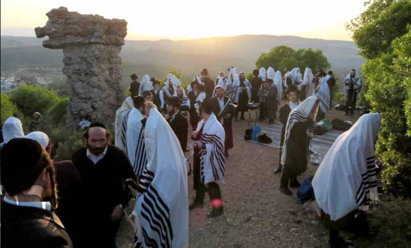
תפילת שחרית בכסא של אליהו

של ספירת העומר, ולפתע אנחנו רואים פנסים מתקרבים לכיוונינו, כולם השתתקו מפחד, אך אז גילינו כי מדובר בקבוצה נוספת של פרטיזנים מאנ"ש, שהסתתרו במקום אחר ונזעקו לשמע הצעקות והשאגות. לאחר מכן רקדנו יחד בערגה וגעגעו לאורו של הרשב"י והלכנו לישון על הרצפה באוהלים על מנת לקום חצות. כה מאירה הייתה אותה התבודדות מלאת געגועים בחצות הלילה, מול הציון המואר, כשהלב כוסף למעיין אבל אינו יכול כלל להתקרב אליו.