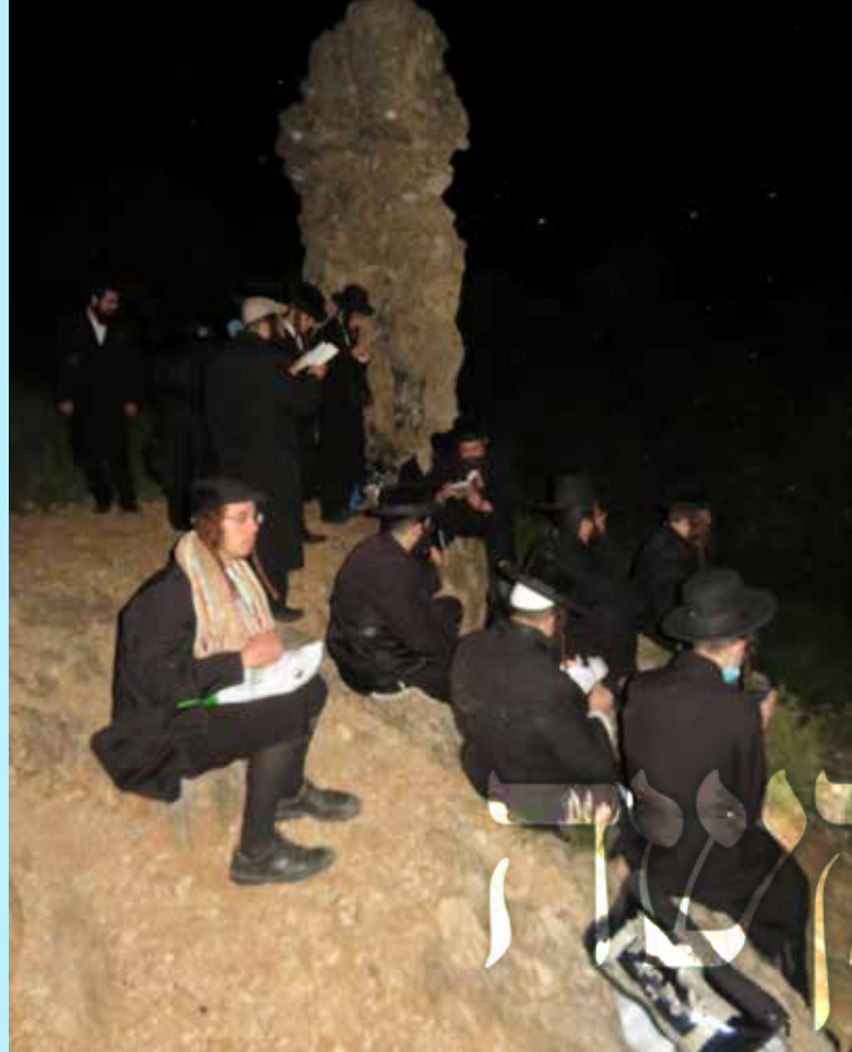
באישון ליל ל"ג בעומר מסתתרים ומתבודדים מול הציון הקדוש

כל הדרך שהלכנו לכיוון החניון כשאנו מובלים על ידי השוטרים שרנו, היינו בשמחה עצומה על כך שאנחנו זוכים להתגלגל ברפש וטיט בשביל עניין גדול כזה, כמה פעמים ניסינו לברוח אבל הליווי היה כבד מאוד. הם הביאו אותנו ממול למערת ר' המנונא סבא שנמצאת על הר מירון עצמו, והודינו להם שנתנו לנו לדרוך על הר מירון עצמו, מקום אשר האור החיים הקדוש כבר הלך על ידיו ועל רגליו מיראת הכבוד.