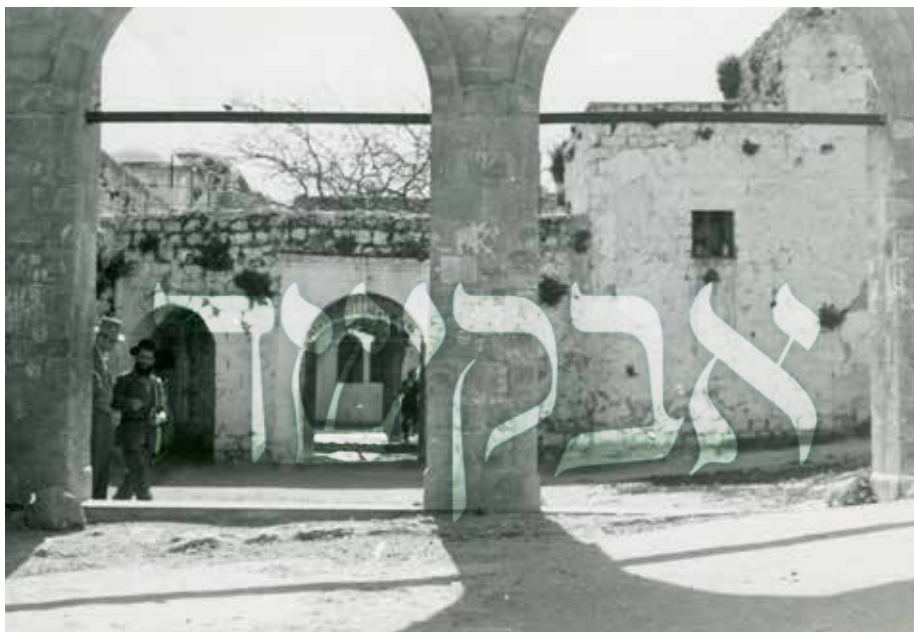
מירון שנת תשי"ח

היה לו חוש מיוחד להרגיש ברעבון של הזולת, כמו גם יכולת מיוחדת לחוש כשהיהודי ההולך מולו ברחוב שרוי בעצבות, מיד היה אומר לו איזו מילה טובה ומרים את מצב רוחו, הרבה 'אוהדי ברסלב' עשה בזכות זה