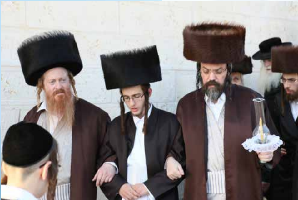
מוביל לחופה את חתנו שבועות ספרים לאחר ההרדמה

אקום מההרדמה ובין אם אני מסיים כעת את חיי - מודה אני לפניך...".