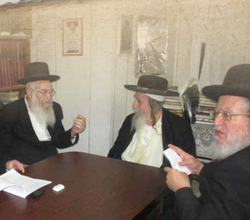
אנשי שלומינו במירון יחד עם ר' לוי יצחק