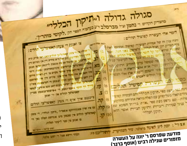
מודעה שפרסם ר' יונה על העשרה (זמורים שגילה רבינו

שיצאו חיים מהמקום הזה, כיוון ששמועות התהלכו שהיו מי שנכנסו למערה ולא נודעו עקבותיהם.