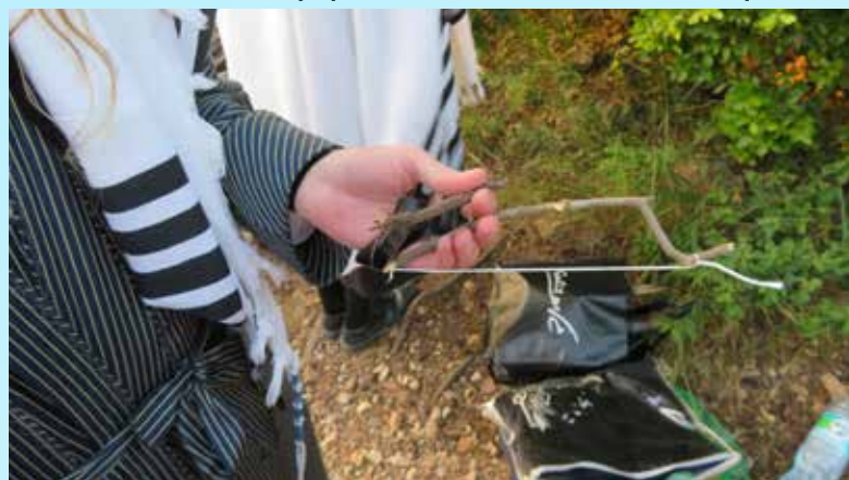
חץ וקשת מאולתרים מחוץ ליישוב

כִּי בְּכַחַם הַקְּדוֹשׁ וְהַנְּשֻׁבָּב נִצָּא מִבֵּין שְׁנֵי הָאָרְיוֹת דְּסִטְרָא אַחְרָא שֶׁהוּא זֶה לְעַמְתָּ זֶה, וְנִזְכָּה לְבְחֵינָת שְׁנֵי הַמַּזְבָּח בְּדַבְרֵי הַקְּדוֹשִׁים לְקוּטֵי תַנְיָנָא סִמְן פִּי, שֶׁהוּא רְאִשֵׁי תְּבוּת שְׁבֵת נִחְמו (נְחַמַת הַגְּאֻלָּה) הַמְּכֻן גַּם לְרְאִשֵׁי תְּבוּת שֶׁל שְׁמוֹתֵיהֶם הַקְּדוֹשִׁים שִׁמְעוֹן נִחְמו זְכוּתָם יְגַן עֲלֵינוּ וְעַל כָּל יִשְׂרָאֵל אָמֵן. (כוכבי אור שם)