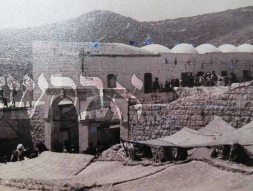
האהלים במירון בל"ג בעומר בימי התורכים