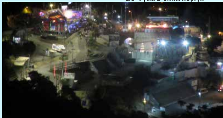
ציון הרשב"י כפי שנראה מההר בשממונו